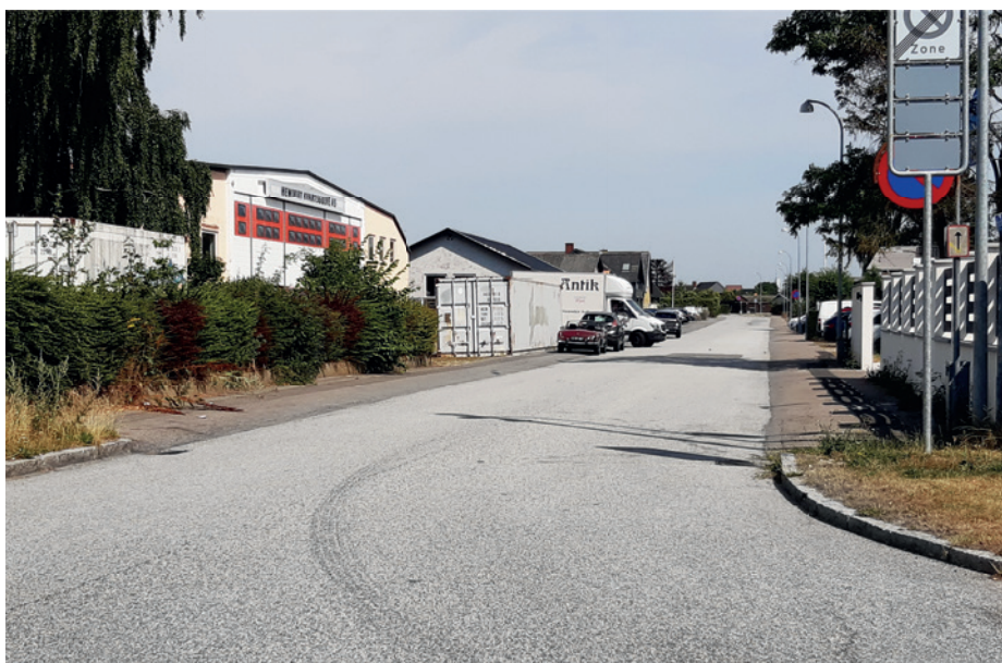
Ved Knudslundvej er der primært mindre virksomheder og værksteder.