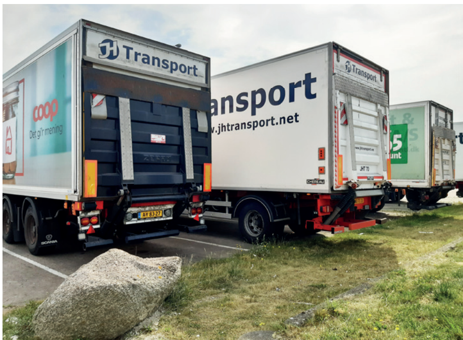
Der er mange logistikvirksomheder i området. Fotoet er fra JH Transport på Solmarksvej.