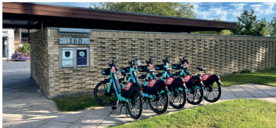
Flotte el-delecykler på rad og række foran Brøndby Rådhus, lige til at låne og køre videre på arbejde på.