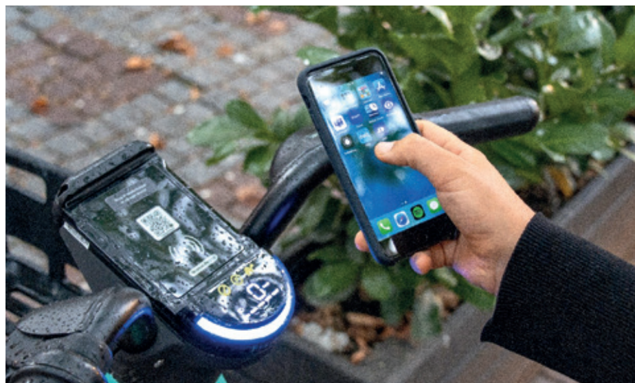
Du lejer el-delecyklerne i app'en Dott – Unlock Your City.

Projektet med delecyklerne løber til udgangen af 2025, med mulighed for en 1-årig forlængelse.