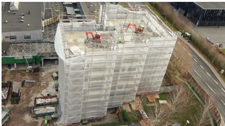
Et overblik fra nedrivningen af et højhus i Brøndby Strand.

En indskærpelse bruges, når kommunen påpeger, at der er et ulovligt forhold, og at den ansvarlige skal bringe det i orden. Det kan også ses som en løftet pegefing, og hvis forholdet ikke bringes i orden, vil en politianmeldelse være det næste skridt.