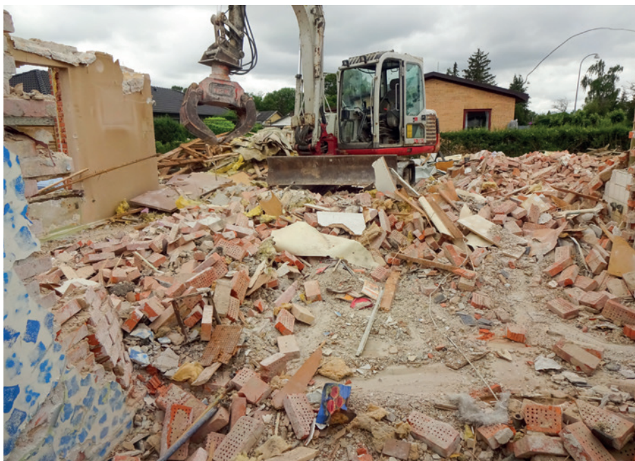
En nedrivning der ikke lever op til kravene om sortering af byggeaffaldet.

Fra 2023 skal alle landets virksomheder sortere husholdningslignende affald i de samme 10 affaldstyper, som man gør i private hjem. Vi har derfor i 2022 haft særligt fokus på