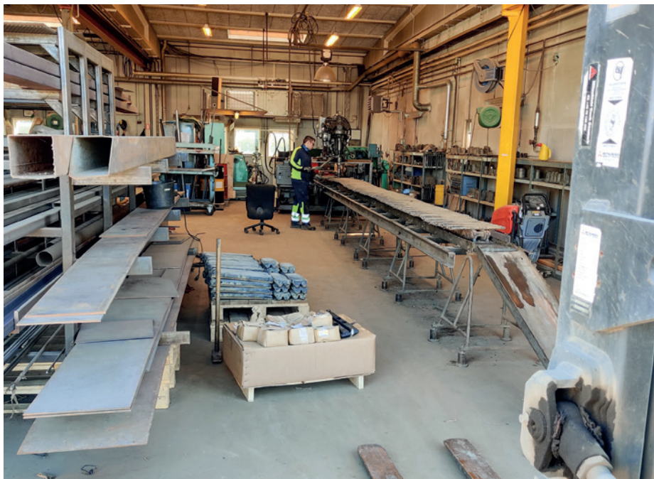
Reparation af larvefodder til en gravemaskine (Zeppelin).

Der blev og bliver fortsat udført hyppige tilsyn med nedrivningen af højhusene i Brøndby Strand, og der har ligeledes været en jævn strøm af tilsyn med andre større byggerier i kommunen. Nogle af disse tilsyn var i forbindelse med jordforureninger og §8 tilladelser til byggerier på forurenet grund. Disse er – sammen med spildevandstilsyn - lagt sammen med de øvrige §42-tilsyn i tabellen, mens rottesager og andre tilsyn på private ejendomme har deres egen række.