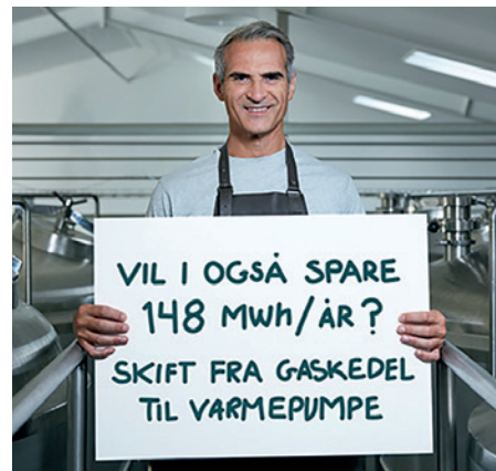
Der er højt tilskud til konvertering væk fra gas

Erhvervspuljen løber frem til 2029, og både små og store private virksomheder i næsten alle brancher kan få tilskud til næsten alle typer projekter, der sparer energi eller CO 2 fra energiledninger. På Energistyrelsens hjemmeside www.spareenergi.dk/erhvervstilskud kan man læse mere om puljen. Her findes der også cases fra andre virksomheder og mulighed for at beregne, hvor meget man kan forvente at få i tilskud ved udskiftning til LED-belysning eller udskiftning af kedler.