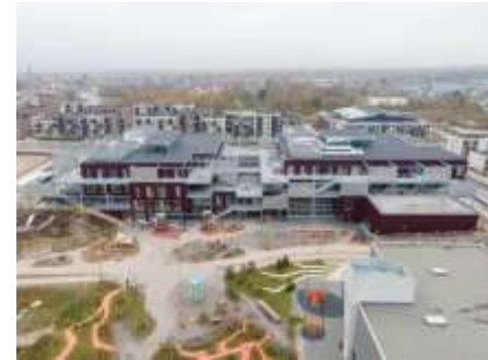
Vrå Børne- og Kulturhus