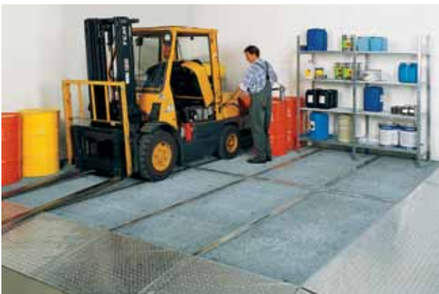
Undgå opkanter ved brug af køreramper, let at komme til samt håndtere produktet uden at spilde dvs.