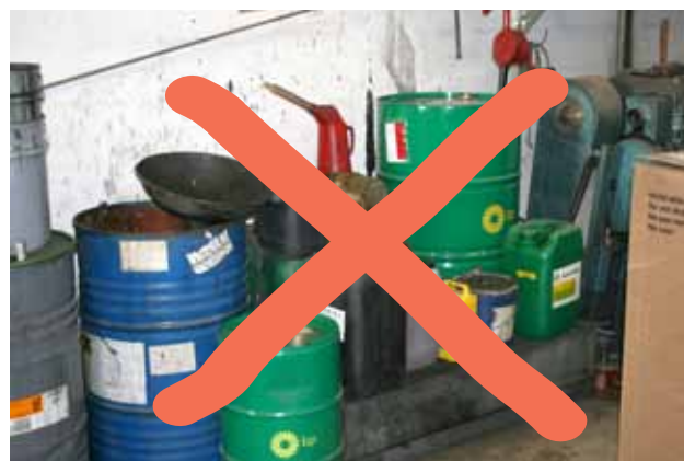
Undgå opstabling af beholdere og opstabling udenfor spildbakke.