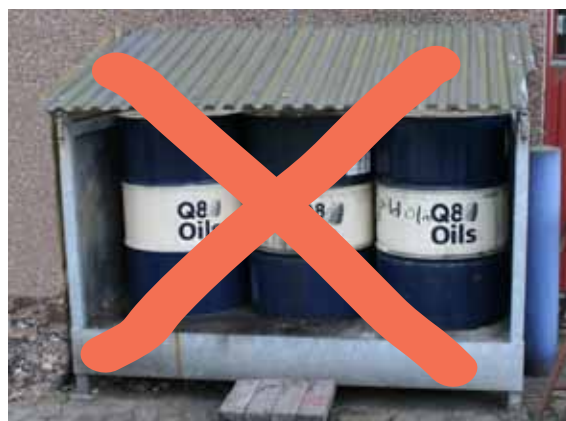
Undgå utætte belægnings og manglende sikring mod regn og sne m.m.