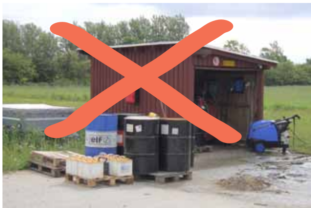
Undgå ubeskyttede oplag direkte på belægning.