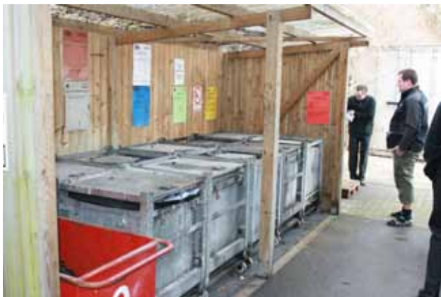
Spildebakke der kan rumme indholdet af den største beholders indhold – brug godkendte affaldscontainere.