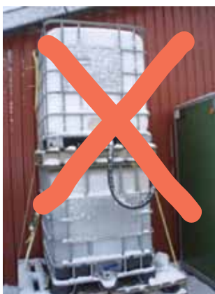
Undgå ubeskyttede oplag og undgå opstabling af beholdere.

Ved udendørs opstilling af skur eller container – undersøg om du skal have byggetilladelse hos kommunen.