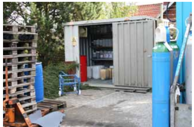
Lille container til udendørs opbevaring af farligt affald og farlige råvarer og produkter.