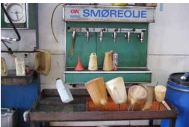
Aftapningssted for spildolie samlet på et dertil indrettet sted.