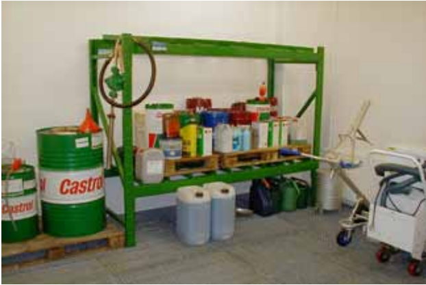
Afgrænset arbejdsområde til håndtering af olier og kemikalier og placering af gulvvaskemaskine – gulv består af riste i kar, der fungerer som spildbakke.