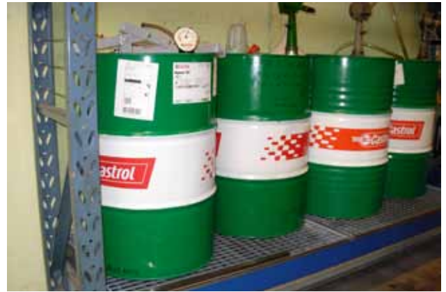
Råvareoplæg stillet på reol oplæg med kar til opsamling af evt. spild og lækager.