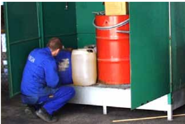
Minicontainer der kan lukkes til udendørs opbevaring af farligt affald, råvarer og produkter.