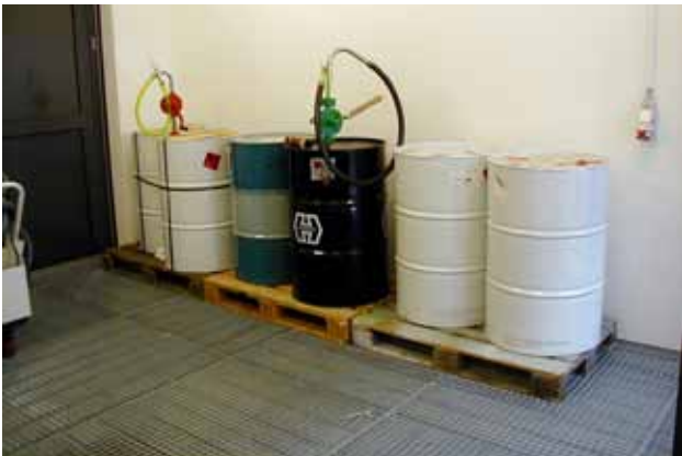
Afgrænset arbejdsområde til håndtering af olier og kemikalier med kørevenligt gulv.