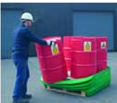
Gummi indsats til 4 tromler – god ved transport af tromler – kun til midlertidig opbevaring ved transport.