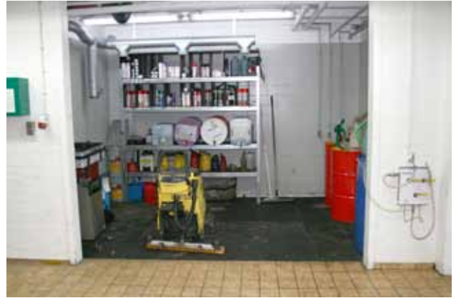
Sikret rum, hvor gulv er forsænket, belagt med rist således at der er et samlet kar, hvor evt. spild opsamles.