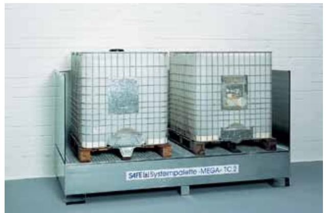
Spildbakker under tappehaner. Tilstrækkelig opsamlingsvolumen til største beholders indhold.