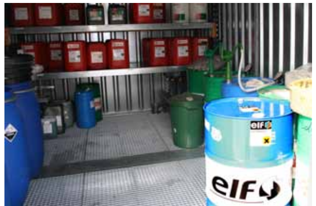
Stor container med opkant, rist og sikret bund.