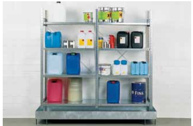
Råvareroplæg på reol, stillet i kar til opsamling af evt. spild og lækager.