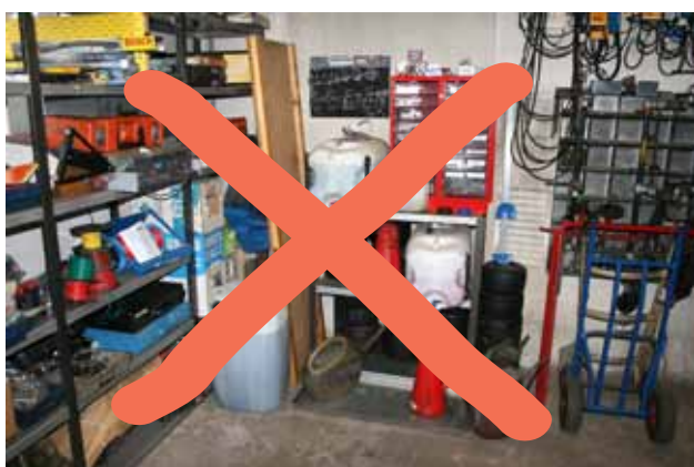
Undgå opstabling af beholdere og opstabling udenfor spildbakke.