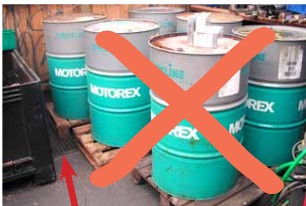
Undgå opbevaring af farligt affald og råvarer ved eller ovenpå afløb til kloak.