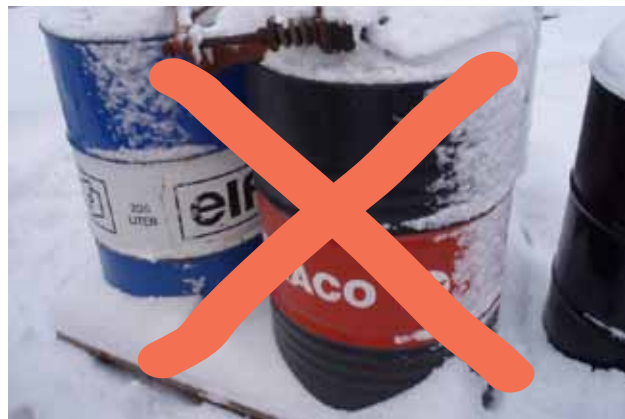
Undgå ubeskyttede oplag af farligt affald, råvarer og produkter.