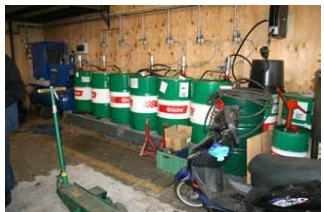
Direkte sug/rørføring fra råvarer beholder til brugssted betyder minimering af spild ved håndtering.