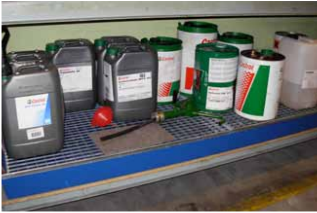
Råvareoplæg stillet på reol med kar til opsamling af evt. spild og lækager.